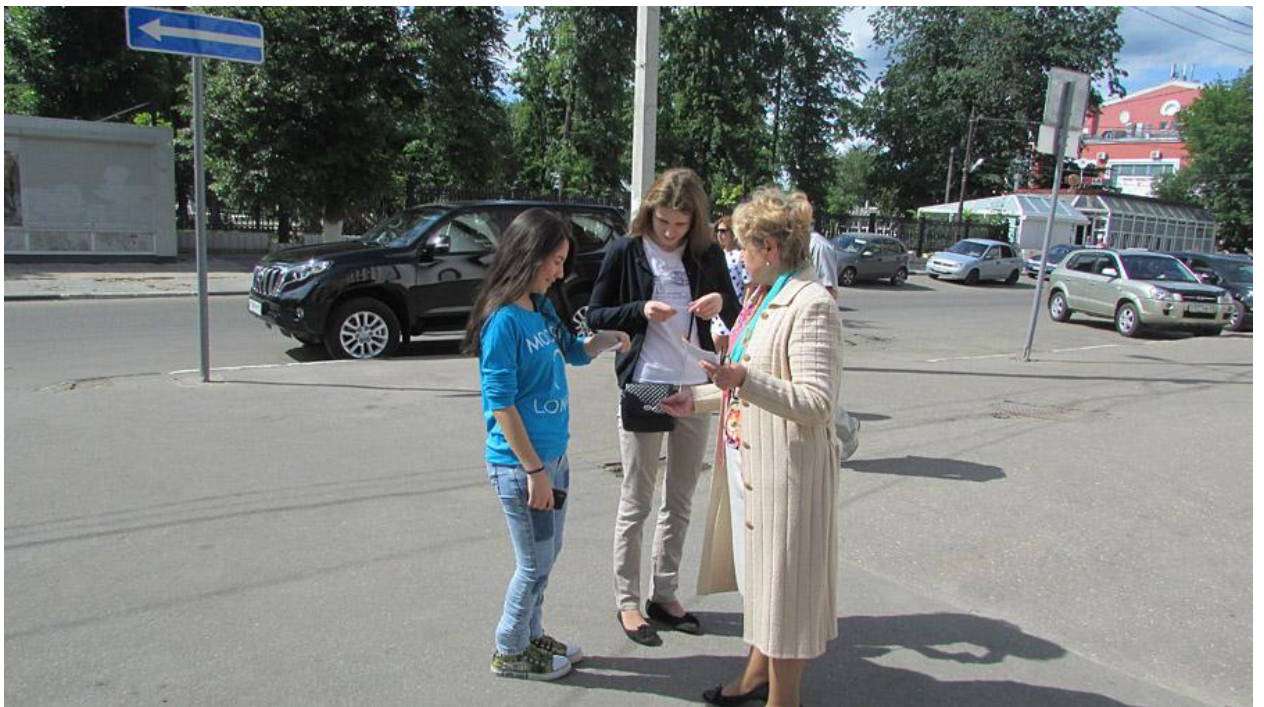
Молодые жители Твери участвуют в акции «Стихи в кармане»