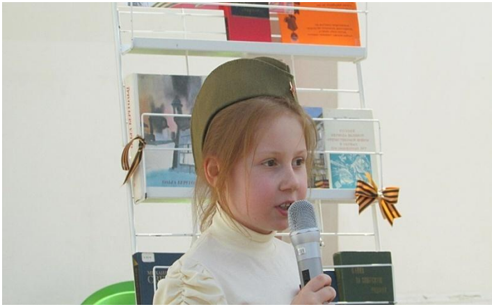
Стихи о войне читают дети ...