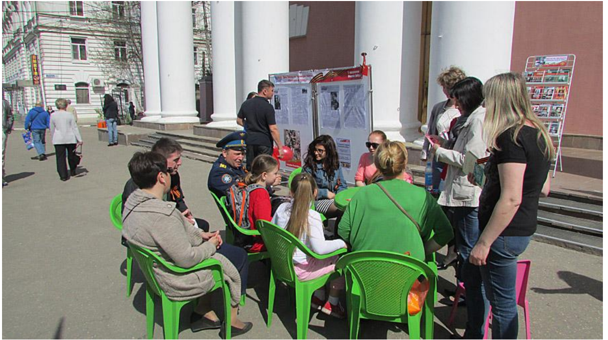
Библиотекари проводят викторину «Знать и помнить»