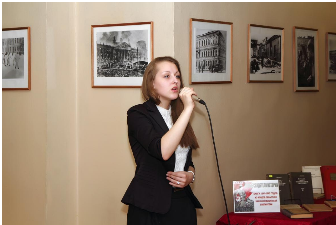
Выставка фотографий военного времени, книг, изданных 1941-1945.