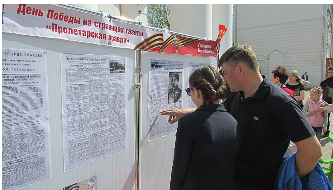
Жители и гости города с интересом читают «Пролетарскую правду» от 9 мая 1945 года