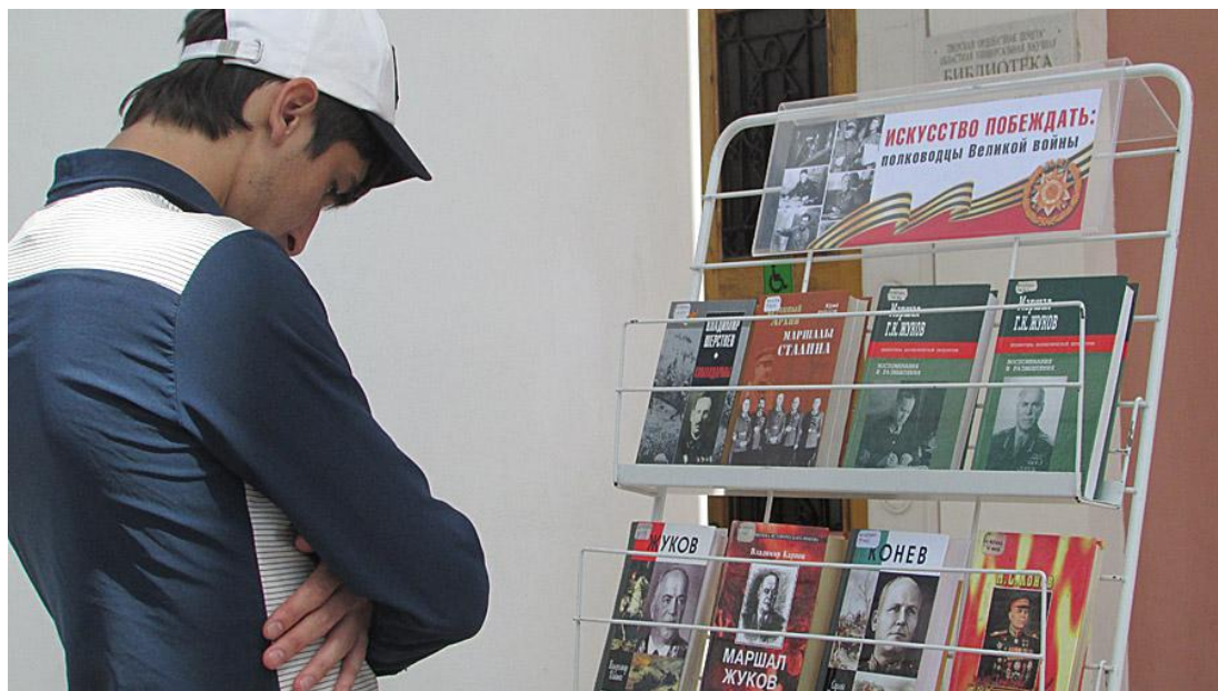
У книжной выставки

иллюстративные выставки: «Искусство побеждать», «Вечно памятью живы», «Главные книги о Великой войне», «Мыслить и побеждать». На них было представлено более 200 литературных изданий. Горожане с интересом принимали участие в викторине «Знать и помнить», вопросы которой были посвящены датам и событиям войны. Победителям вручались призы - книги. У «свободного микрофона» звучали стихи К. Симонова, О. Берггольц, Ю. Друниной, Р. Гамзатова, А. Твардовского... в исполнении детей и взрослых. Активно проходила акция «Стихи в кармане»: прохожие с удовольствием разбирали карточки со стихами о войне и Победе.